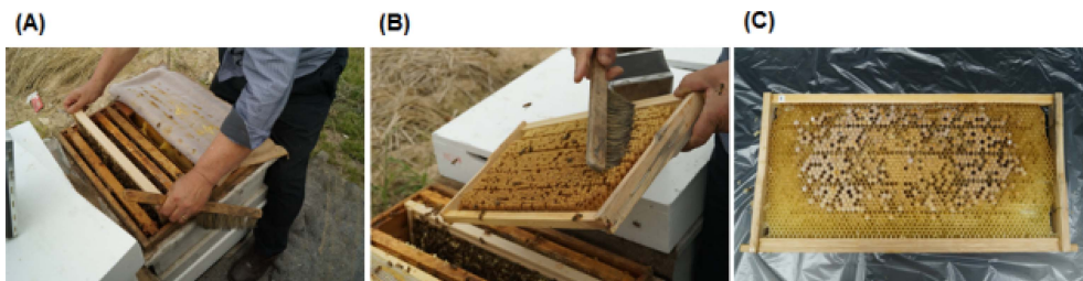
Fig. 1. Collection process of honeybee drone pupa from bee hives. (A) drone pupa'comb take out in bee hives, (B) remove the honeybees from comb with brush, and (C) drone pupa's comb.

-20°C에서 냉동 보관한 수벌번데기 시료를 실험에 사용하기 위해 각각의 소비를 동결건조 방법으로 전 처리하였다. 수벌번데기를 동결건조하기 위하여 동결건조기(SFDSM24L, Samwon Freezing Engineering Co.)에서 72 시간 동안 처리하였다. 전처리를 한 각각의 시료는 실험 전까지 -70°C에서 냉동보관 하였다.